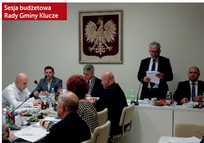
Sesja budżetowa Rady Gminy Klucze