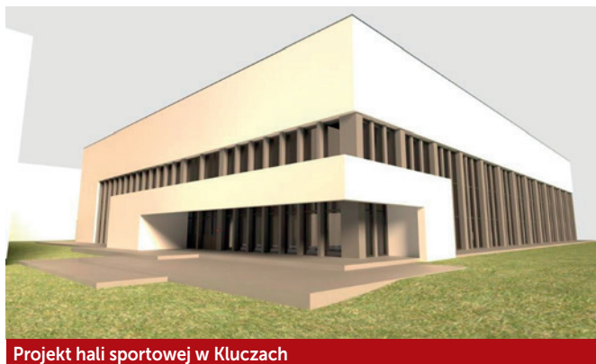
Projekt hali sportowej w Kluczach