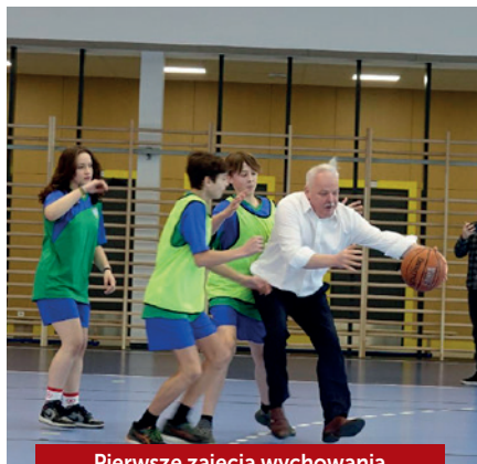
Pierwsze zajęcia wychowania fizycznego na nowo wybudowanej hali sportowej