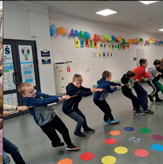
Ferie na sportowo 2023 w Gminie Klucze.