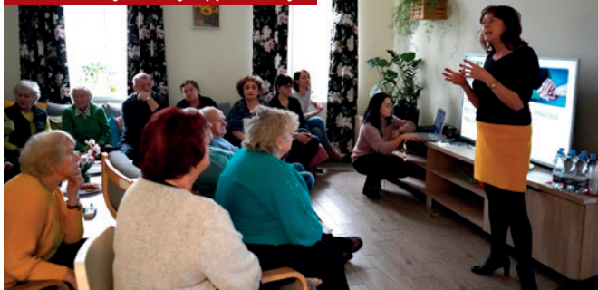
Spotkanie z seniorami w Dziennym Domu Seniora w Kluczach, odbywające się w ramach projektu „Otwórz oczy, nie daj się przemocy!”