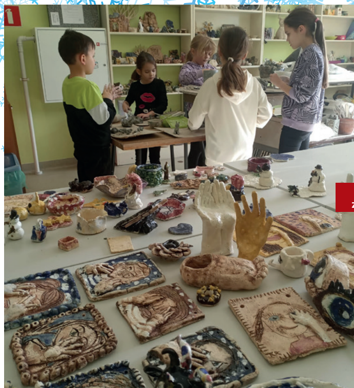
Ferie z GOK Klucze