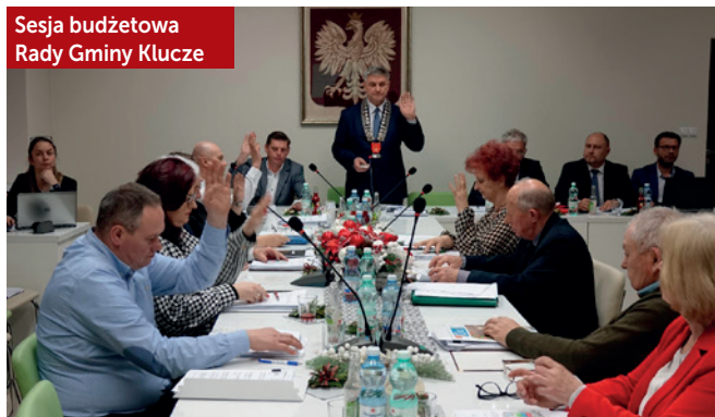
Sesja budżetowa Rady Gminy Klucze

wzrost (po 8 latach stabilności) nie skompensuje jednak wpływów z PDOF. Podniesienie stawek podatków jest podyktowane koniecznością zwiększenia dochodów bieżących budżetu gminy, pozwalających na realizację aktualnych zadań w perspektywie wzrastających cen towarów i usług. Zgodnie z ustawą o finansach publicznych, wydatki bieżące mogą być pokryte z bieżących dochodów. Podatki lokalne, w tym podatek od nieruchomości, to jedno z głównych źródeł finansowania zadań własnych, dlatego należy je utrzymać na stosownym poziomie.