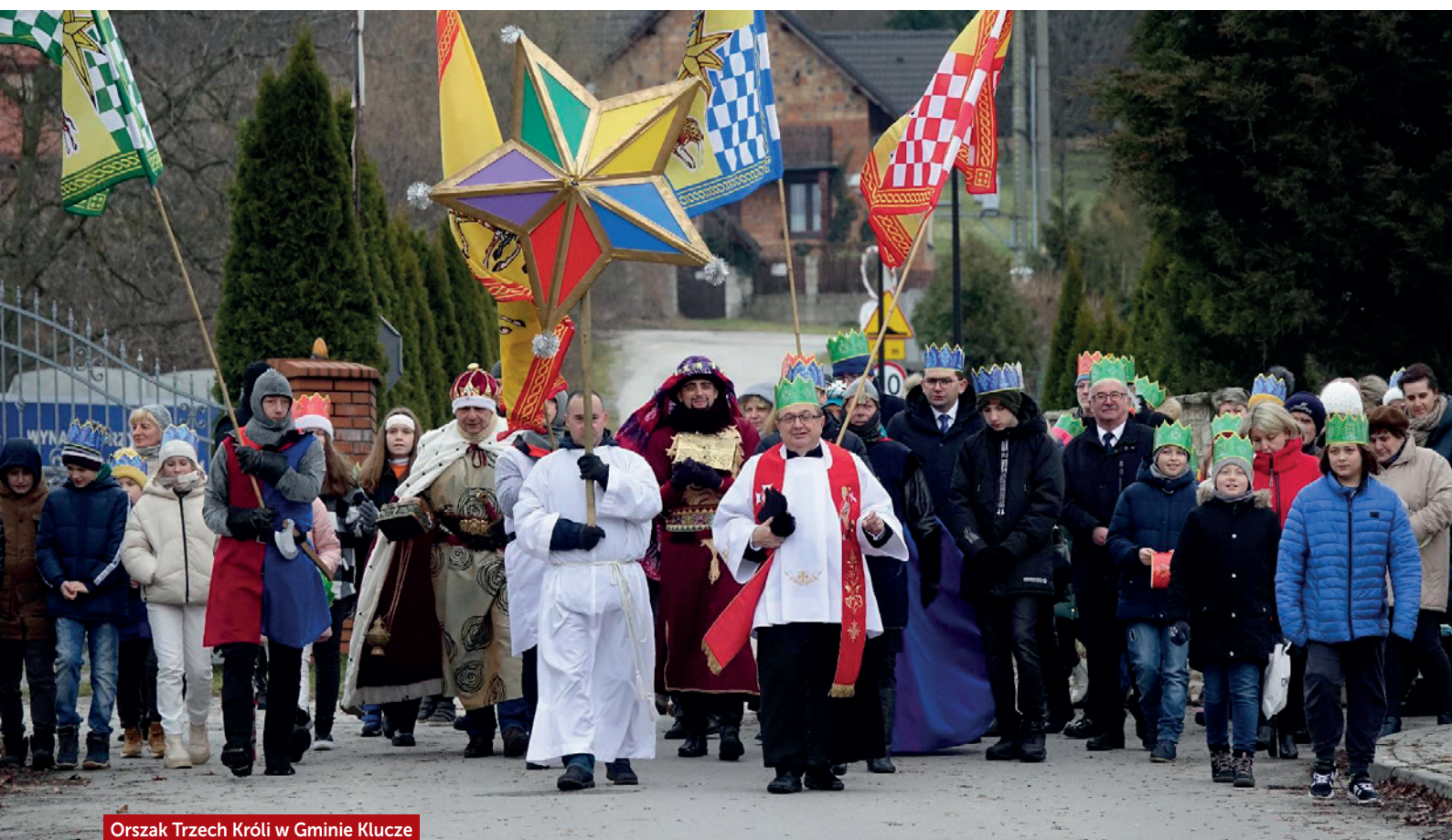
Orszak Trzech Króli w Gminie Klucze

Po mszy świętej, orszak na czele z Trzema Królami: Kacprem, Melchiorem i Baltazarem, symbolizującymi trzy kontynenty – Europę, Azję i Afrykę, wyruszył spod kościoła i ulicami Klucza podążył w kierunku Szkoły Podstawowej, gdzie odbyło się przekazanie darów nowonarodzonej Bożej Dziecinie. Zanim jednak Mędrcy dotarli do celu odwiedzili po drodze gospodę oraz dwór Heroda, gdzie odbyła się walka dobra ze złem. Świadcami, a zarazem uczestnikami tych wydarzeń byli mieszkańcy gminy oraz przybyli goście, którzy ubrani