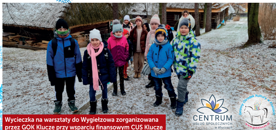
Wycieczka na warsztaty do Wygiełzowa zorganizowana przez GOK Klucze przy wsparciu finansowym CUS Klucze

Ci, którzy uwielbiają ruch i aktywność fizyczną, mogli skorzystać z oferty fe-