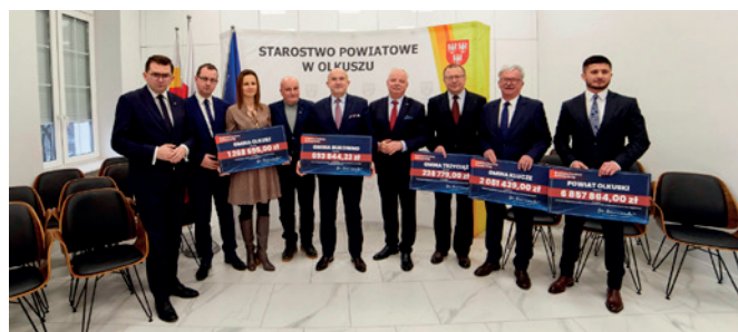
Samorządowcy ziemi olkuskiej podczas uroczystości przekazania symbolicznych czeków, na realizację inwestycji w gminach powiatu olkuskiego.